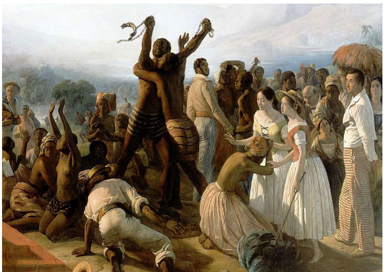
L'abolition de l'esclavage dans les colonies françaises en 1848

Devenus libres , les esclaves furent payés pour leur travail, comme les autres travailleurs, et purent choisir leur métier et leur mode de vie .