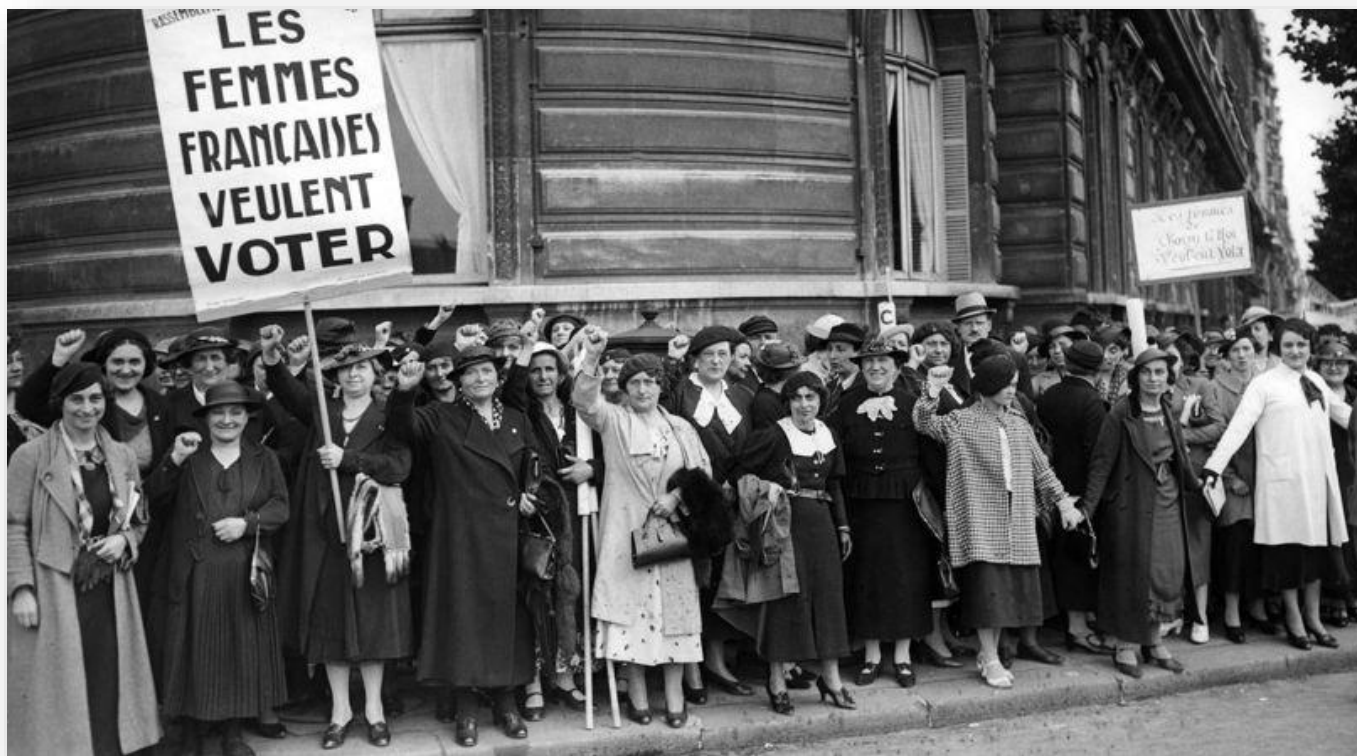
Manifestation de femmes françaises pour le droit de vote à Paris en 1936

Mais des inégalités continuent d'exister : il y a peu de femmes ministres, députés ou chefs d'entreprise . Les salaires des femmes restent inférieurs à ceux des hommes .