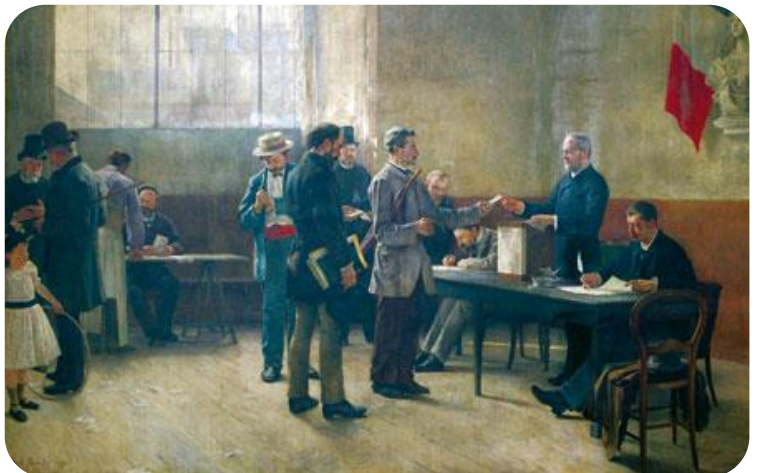
Bureau de vote (tableau de 1891)

En 1848 , sous la Seconde République, une loi a accordé le droit de vote à tous les hommes de plus de 21 ans : c'était le suffrage masculin .